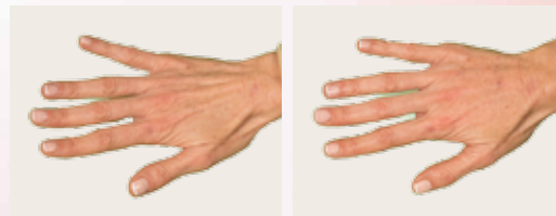
Después del tratamiento